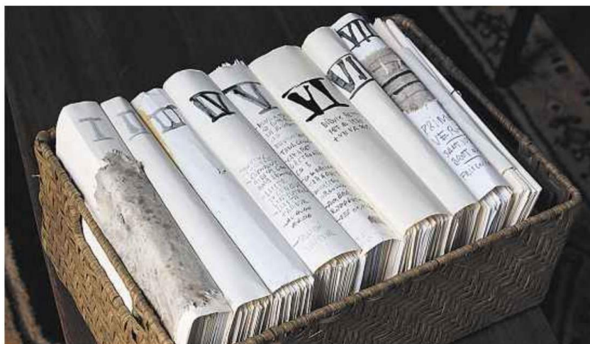
'Diaris', 2011. L'artista es converteix en un provocador de relats. La seva feina consisteix a saber escoltar i explicar històries.

per exposar-les. Deia que era més important el procés que l'obra acabada", puntualitza la comissària.