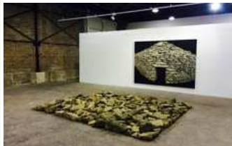
Una de les obres de l'exposició 'Llindars en el punt immòbil del món que gira'

En l'exposició 'Llindars en el punt immòbil del món que gira', l'artista d'Igualada Jordi Fulla ha convertit les construccions de pedra seca escampades per tota l'àrea mediterrània en espais de pensament. En les seves pintures ha plasmat les sensacions que aquestes obres arquitectòniques li han transmès durant llargues estades i temporades en el món rural. Les seves obres són quadres de gran i mitjà format que a certa distància es confonen fàcilment amb fotografies, però que, en observar-los de prop, esdevenen autèntics dibuixos amb vida pròpia que exerceixen de pont al nostre passat arquitectònic.