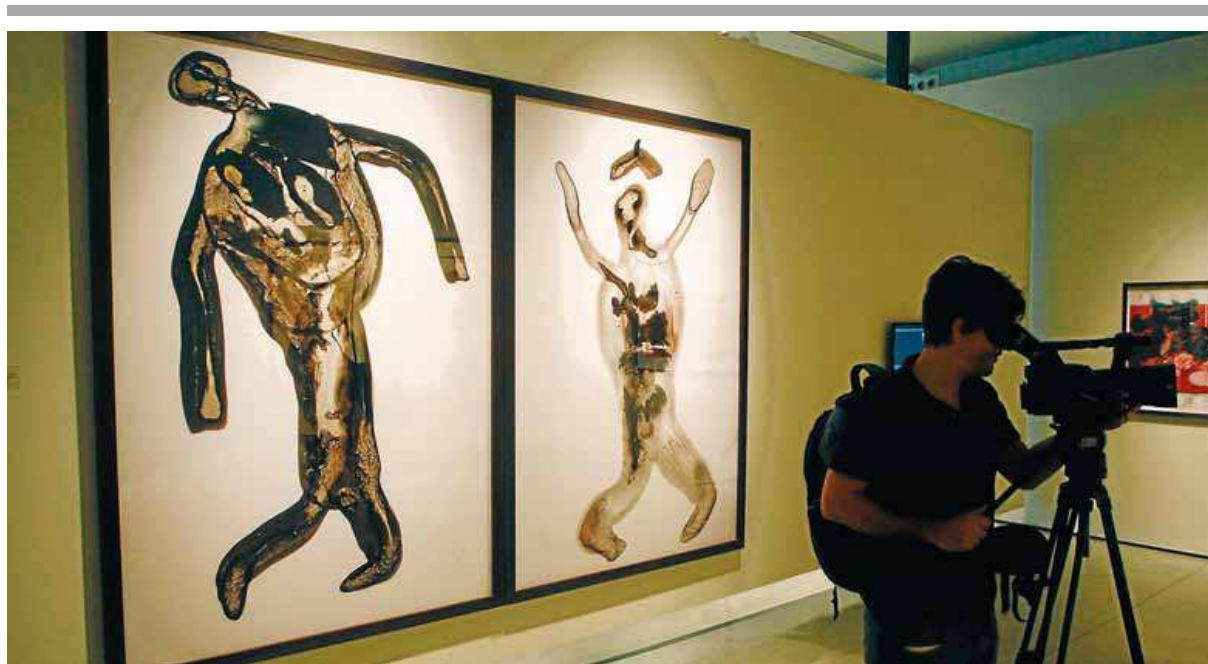
Obres de la sèrie dels ninots, en l'exposició de Bigas Luna al Museu Can Framis de la Fundació Vila Casas ■ ORIOL DURAN

Can Framis inaugura l'exposició més important a Barcelona amb obra plàstica del malaguanyat director de cinema Bigas Luna