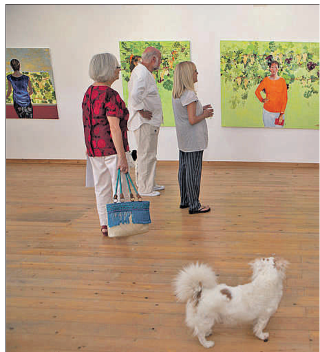
Las obras de Artigau se exponen junto a las de Serra de Rivera en KM7