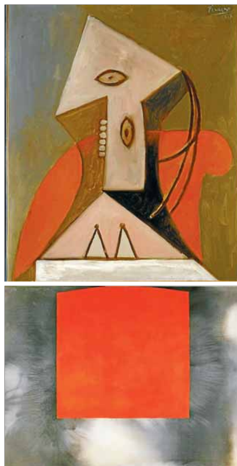
Obres de Leopoldo Pomés, Maria Lassnig, Picasso i Alfons Borrell, que lluiran a la Pedrera, la Fundació Tàpies, el Museu Picasso i la Fundació Miró. A sota, la màgia de Pixar ■ EL PUNT AVUI