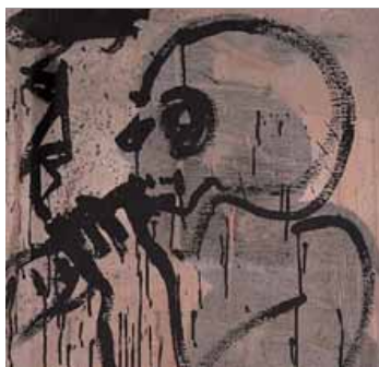
L'obra que obre el recorregut expositiu ■

Amb aquest esperit desacomplexat —“amb por, no tens cap oportunitat que et surti res”—, Puig ha realitzat un immens mural que ocupa la primera sala tota sencera (tres parets) de Can Framis,