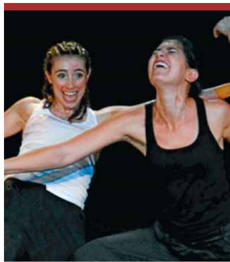
Una escena de l'obra ■ WWW.TANTARANTANA.COM

« Scott H. Biram El concert de rock té lloc a la sala Rocksound, a les 21.00 h.