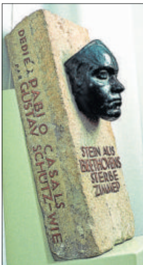
MUSEU PAU CASALS