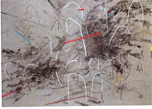
Julie Mehretu. Half to rise and half to fall. 2008. Fundació Sorigué.