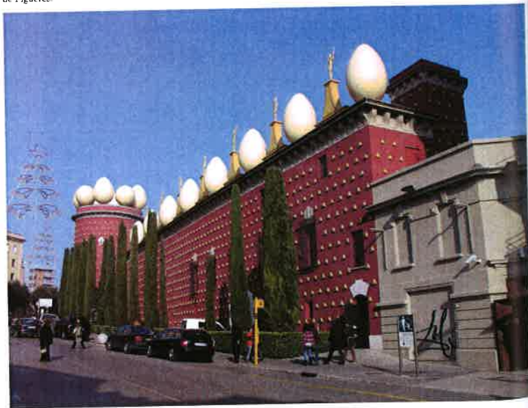
Fundació Gala-Salvador Dalí. Façana del Teatre-Museu Dalí de Figueres.