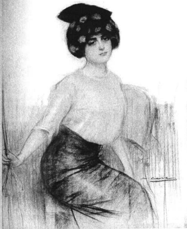
Ramon Casas. Júlia amb barret i para-sol. Cap al 1919. Museu del Mo- dernisme Català.

Un exemple de col·leccionista més acumulatiu és el protagonitzat per Víctor Balaguer (Barcelona 1824 – Madrid 1901), considerat un dels polítics i escriptors catalans més importants del segle XIX. Entenia que la construcció d'un país s'havia de fer simultàniament des de tots els terrenys. Amb la voluntat d'oferir al públic les seves múltiples col·leccions, va encarregar a Jeroni Granell un dels primers edificis públics construïts a Catalunya amb finalitats museístiques, la Biblioteca Museu Víctor Balaguer (Vilanova i la Geltrú). El fons estava format per objectes procedents tant de Catalunya com d'altres cultures, destacar molt especialment del món egipci, fet que convertia part de les sales en mostres de curiositats exòtiques. www.victorbalaguer.cat