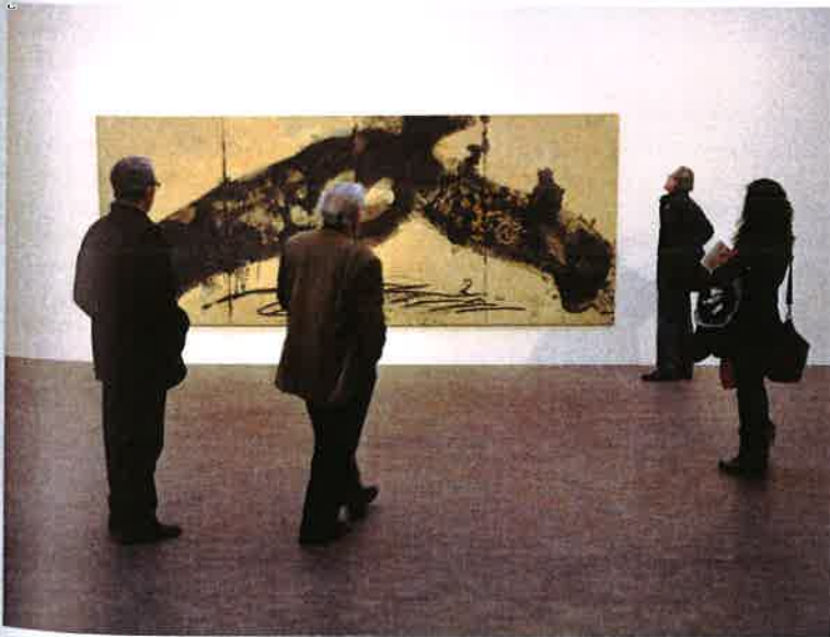
Fundació Antoni Tàpies Tàpies, Antoni Tàpies. Col·lecció # 6 © Fundació Antoni Tàpies 2014.

La Fundació Gala-Salvador Dalí s'ocupa del Teatre-Museu Dalí a Figueres, de la casa de l'artista a Portlligat i de la casa castell Gala Dalí a Púbol. Gestiona uns 4.000 objectes, entre pintures, dibuixos, escultures, gravats, instal·lacions, joies, hologrames i pintures estereoscòpiques, entre d'altres. La major part de l'obra de Dalí es concentra al Teatre-Museu, que obrí les portes el 1974, però les aportacions escenogràfiques al museu, el mobiliari modernista, el taxi plujós, els fanals del metro de París, els objectes que Dalí distribuï per sales i passadissos, la instal·lació que reconstrueix el rostre de la Mae West, els hologrames i altres experiments òptics, com ara les anamorfosis o les pintures estereoscòpiques, enriqueixen una col·lecció cronològicament molt rica, escenogràficament molt atractiva, que troba complementarietat en les obsessions de Dalí: els gravats de les presons de Piranesi, o autors de referència de la seva pintura, com ara Modest Urgell, Marià Fortuny, Meissonier o Marcel Duchamp.