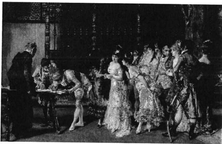
Marià Fortuny. La vicaria. Col·lecció MNAC.