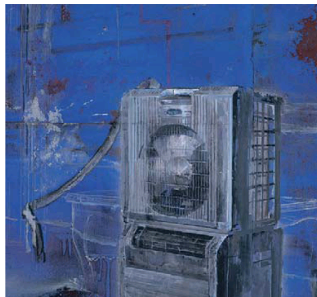
Detall de 'Azul rasgado' (2012).