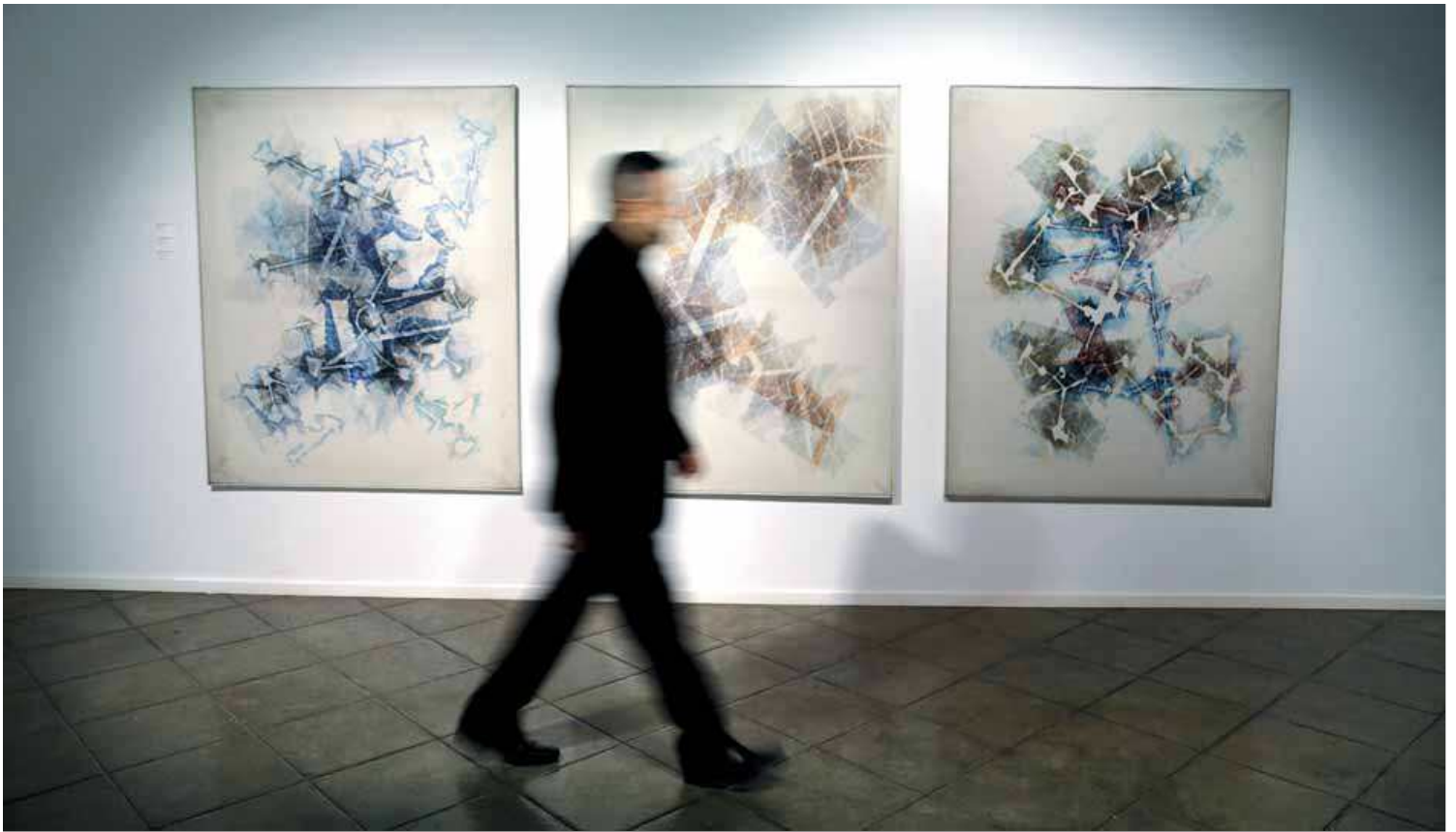
Les planimetries de Joan Vilacasas són un assoliment molt interessant del pintor dins del seu llenguatge totalment abstracte ■ QUIM PUIG

L'Espai Volart de Barcelona recupera la figura d'aquest pintor informalista, més conegut per les seves obres teatrals i per haver estat guionista de Joan Capri