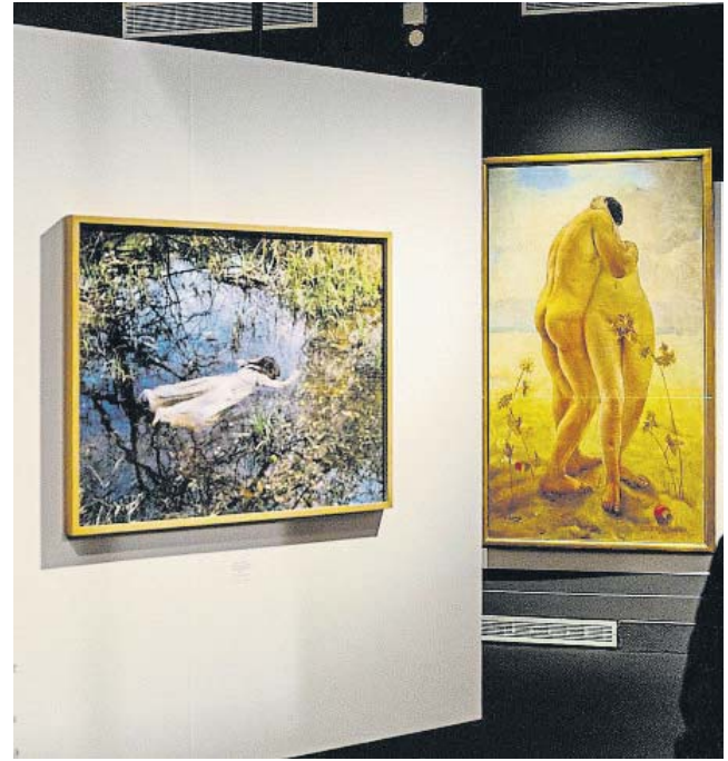
Rodoreda, un bosque. La muestra que el CCCB dedica a la escritora

El DHub recupera las imágenes que la fotógrafa Isabel Steva Hernández, más conocida como Colita, aportó al libro gráfico Antifemina , hecho a cuatro manos junto con Maria Aurèlia Capmany, considerado el primer libro abiertamente feminista de la transición. La muestra, que el pasado año triunfó en el Círculo de Bellas Artes de Madrid, se presenta en Barcelona en una