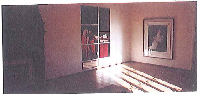
Fundació Vila Casas

La Fundació Vila Casas ha presentat la reestructuració dels fons de les col·leccions permanents del Museu de Fotografia Contemporània del Palau Solterra (Torroella de Montgrí) i del Museu d'Escultura Contemporània de Can Mario (Palafrugell).