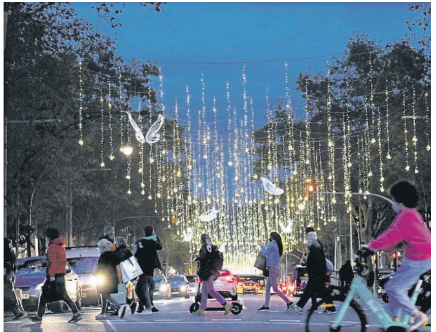
En el adornado paseo de Gràcia, la casa Batlló y la casa Milà proponen visitas nocturnas

Las luces festivas de esta temporada iluminan rincones ocultos de museos, edificios históricos y espacios culturales