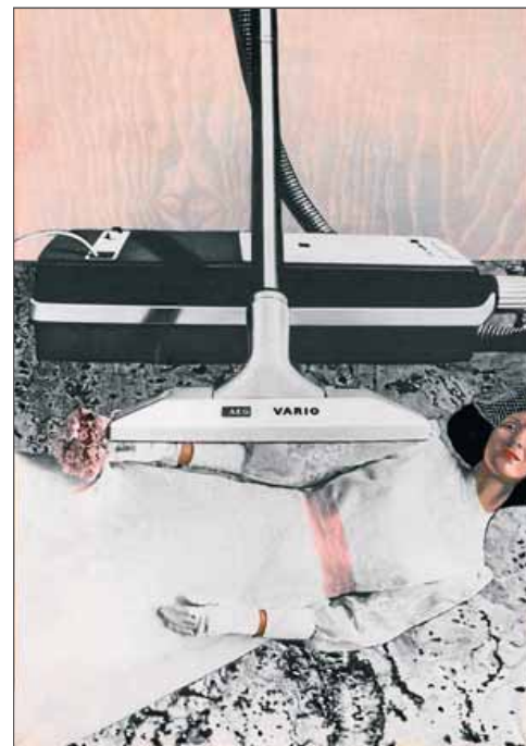
'Fusta i finestres' (1976), de Tàpies (plana del costat). A dalt, Pasolini, en una de les imatges que es veuran al CCCB. Al costat, a dalt, E.C. Ricart pintat per Miró, una mostra de japonisme. Al costat, esquerra, obra de Chema Madoz. Al costat, autoretrat de Picasso, que s'exposarà al Museu Picasso. Al costat, 'Aspiradora', d'Eulàlia Grau ■ F. TÀPIES / CCCB / SUCCESIÓ MIRÓ / C. MADOZ / SUCCESIÓ PICASSO / VEGAP 2013