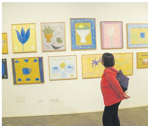
Imatges de l'exposició

posició. S'hi podran trobar paisatges on els elements que en formen part (terra, cel, atmosfera, etc.) i humans estan estretament relacionats.