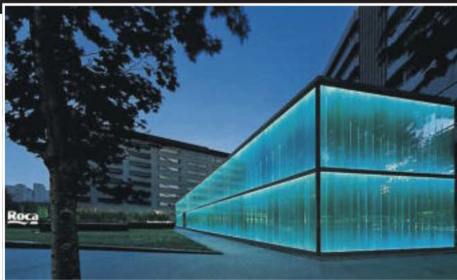
El exterior de vidrio de Roca Gallery fue proyectado por Carlos Ferrater (estudio de arquitectura OAB).