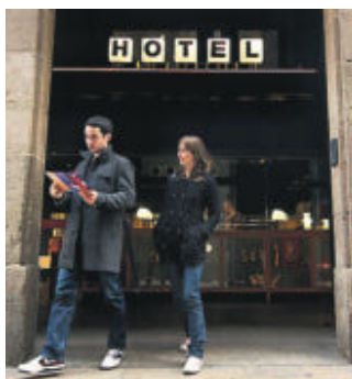
Entrada del hotel Camper.

El creador de piezas míticas como las lámparas TMC, TMM o Cesta, y del banco NeoRomántico, presente en cientos de ciudades, escoge varias localizaciones en su ruta esenciales dentro de la ciudad. Empezaría sus pasos hacia la Casa Milá, La Pedrera, (www.lapedrera.com; 934 84 59 00; paseo de Gracia, 92). "Ha sido para mí", dice, "por su enorme interés en arquitectura y diseño, una fuente de inspiración". Unos metros más allá, Miguel Milá se dejaría caer por la tienda Vinçon (www.vincon.com; paseo de Gràcia, 96), la referencia en diseño