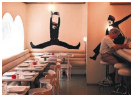
Comedor del restaurante Flash Flash.