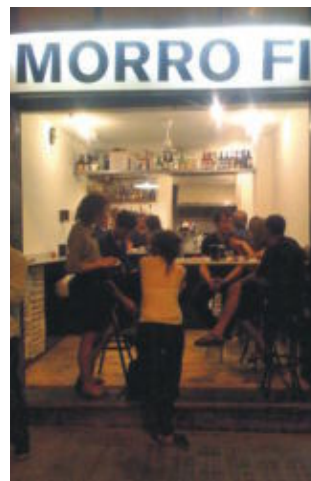
El bar y vermutería Morro Fi.

El Pati de les Dones , en el interior del CCCB , sería la siguiente parada tras tomarse una caña en las terrazas cercanas. Y después, Morro Fi ( http://morrofi.wordpress.com ; calle del Consell de Cent, 157), una vermutería-bar de tres