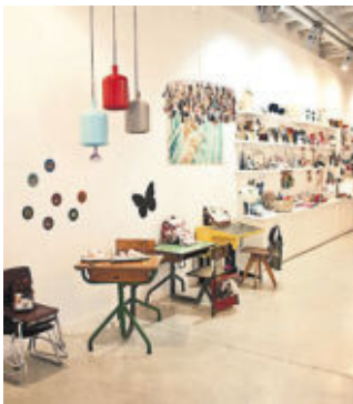
La tienda de diseño infantil Nobodinoz.

hotelescenter.es/casafuster; 902 20 23 45; paseo de Gracia, 132), porque vivió muy cerca. Ahora que es padre promete volver a una tienda por la que pasaba cada día de camino a su estudio, Nododinoz ( www.nododinoz.com ; 933 68 63 35; calle de Séneca, 9), un espacio imprescindible para el diseño infantil que se acoge a la definición de Kid Art Design Store y que entonces miraba casi de lado. "Antes me asomaba a esta tienda con curiosidad, y a veces me atrevía a entrar con timidez y respeto; hoy, siendo padre, me lo compraría todo".