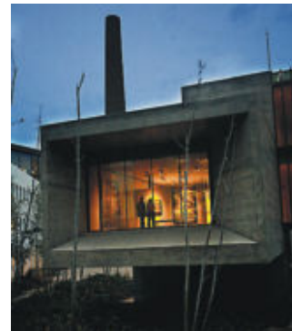
El museo de arte contemporáneo Can Framis.

Parece que de Londres se ha traído el gusto por los jardines secretos y los edificios semiescondidos, pues Zuzunaga tiene en su ruta otros espacios como el museo de arte contemporáneo Can Framis de la Fundació Vila Casas ( www.fundaciovilacasas.com ; 933 20 87 36; calle de Roc Boronat, 116-126), del arquitecto Jordi Badía, y su estudio Baas, "un oasis dentro de Poblenou, un refugio", explica Zuzunaga.