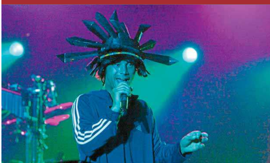
Jason 'Jay Kay', durant la seva actuació a Roses, el juliol del 2005

El gran Lebowski. Cinema a la fresca a la carpa Bamboo de la Devesa. Els germans Cohen presenten un deliri fantàstic, tot i que les idees que expressen són de tocar de peus a terra.