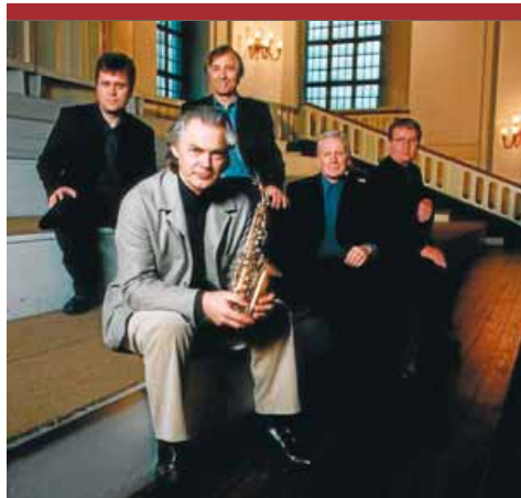
Jan Garbarek i The Hilliard Ensemble.

El gran guitarrista britànic John McLaughlin, tot un referent del jazz del segle XX, continua molt actiu en el segle XXI, als 69 anys. Aquesta nit actuarà amb el seu grup, The 4th Dimension, a l'olivar de Sa Conca, dins del 40è Festival de Cadaqués (22.30 h).