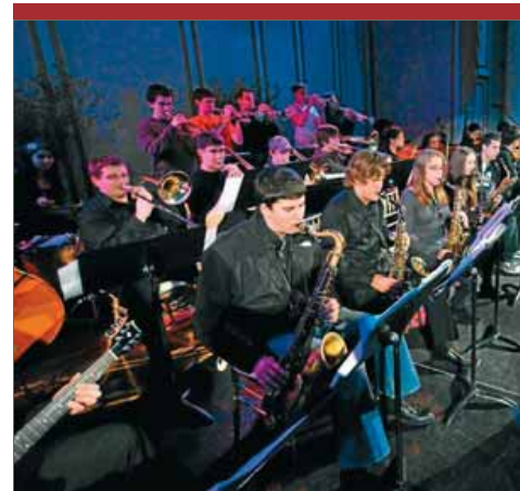
Boston Youth Jazz Orchestra.

El 31è Festival de Músiques de Torroella de Montgrí continua avui a l'església de la localitat empordanesa (22 h) amb un concert del saxofonista noruec Jan Garbarek i el grup vocal britànic The Hilliard Ensemble, que hi presenten Officium Novum .