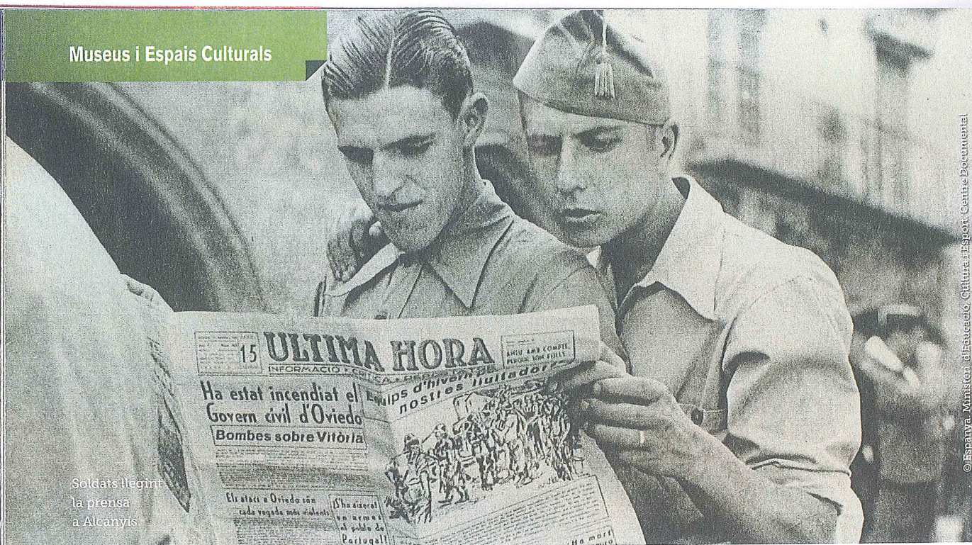
Soldats llegint la premsa a Alcanyis