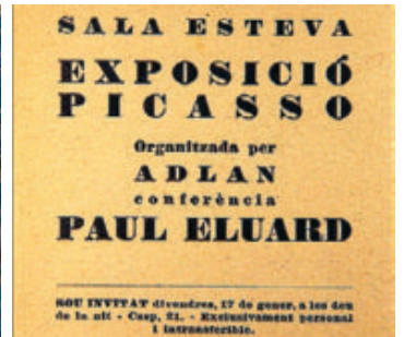
►► A la izquierda, 'Mujer con perro', de Bonnard. Arriba, un documento de la exposición de Picasso del 36. Abajo, una acción de Perejaume.