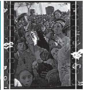
►► A la izquierda, 'La Masia', de Joan Miró. Arriba, 'Madre amamantando a su bebé mientras escucha un discurso político cerca de Badajoz', fotografía tomada por David Seymour en abril o mayo de 1936.