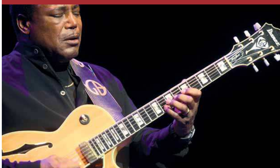
George Benson, en una imatge del concert que va oferir a Cap Roig fa dos anys

Va de bandes. La Federació Catalana de Societats Musicals celebra el XI Festival de Bandes de Música Catalanes. En aquesta ocasió, les bandes que hi actuaran són de les Terres de l'Ebre i de Tarragona. La Banda Municipal de Música d'Alcanar, degana de Catalunya amb més de 167 anys d'existència, començarà un concert amb repertoris