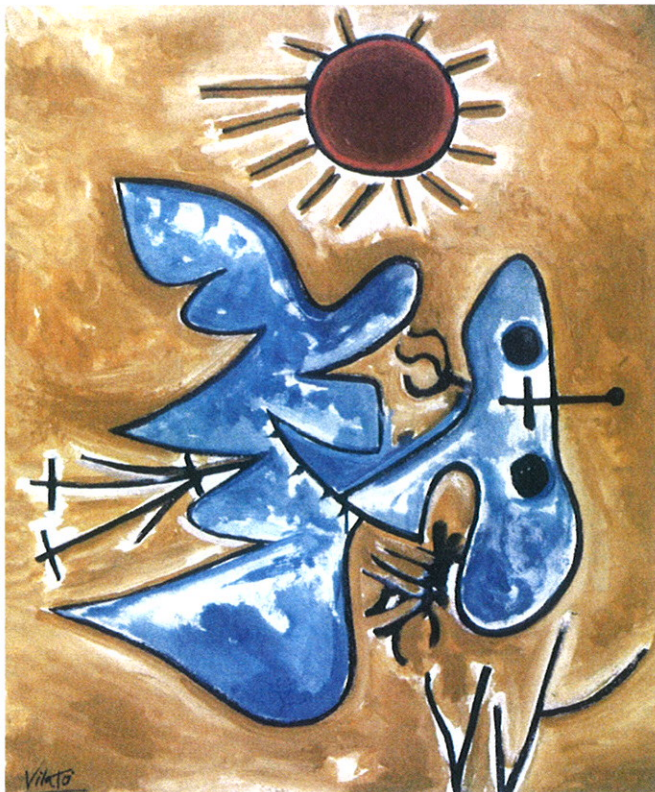
Javier Vilató. Oiseau de nuit et soleil , VII 1977. Oli sobre tela. 73x60 cm.