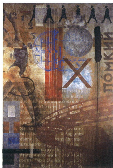
Quim Domene. Varkaus aveneu. 2006. Tècnica mixta sobre cartró-vidre. Obra que s'exposarà al Castell de Benedormiens del 7 al 31 de juliol.

l'escenari d'una exposició de fotografia de Miquel Ribot. Del 27 d'octubre al 18 de novembre s'ha programat la quarta edició de la biennial d'artistes locals. Tancarà el programa les exposicions que s'organitzaran amb motiu de la campanya de Nadal i que tindran lloc del 22 de desembre del 2012 al 12 de gener del 2013. Coincidint amb l'exposició del IV Concurs de Patchword, s'ha previst la celebració, el dia 2 de juny, de les 10 a les 21 h, del mercat de Patchword.