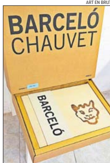
ART EN BRUT

■ El camí emprès per Cazenave el descriu a la perfecció Alejandro Castellote, crític i assagista a més de professional de la fotografia: «Des del negre matricial de l'obscuritat de la cova i el vermell de la terra, fins al blau que s'obre a la immensitat oceànica. La matèria (allò visible) inspira, com a diu Zong Bing, l'espiritual (el que és invisible). A UR AITZ —títol de la mostra— Cazenave utilitza la intervenció amb pigments naturals tant sobre fotografies de paisatge (en una mena d'homenatge al gest primigeni de l'home a la cova) com en pedres; un gest mitjançant el qual l'artista aprofundeix en la importància de l'experiència corporal i del seu encontre amb la naturalesa». E. CAMPS