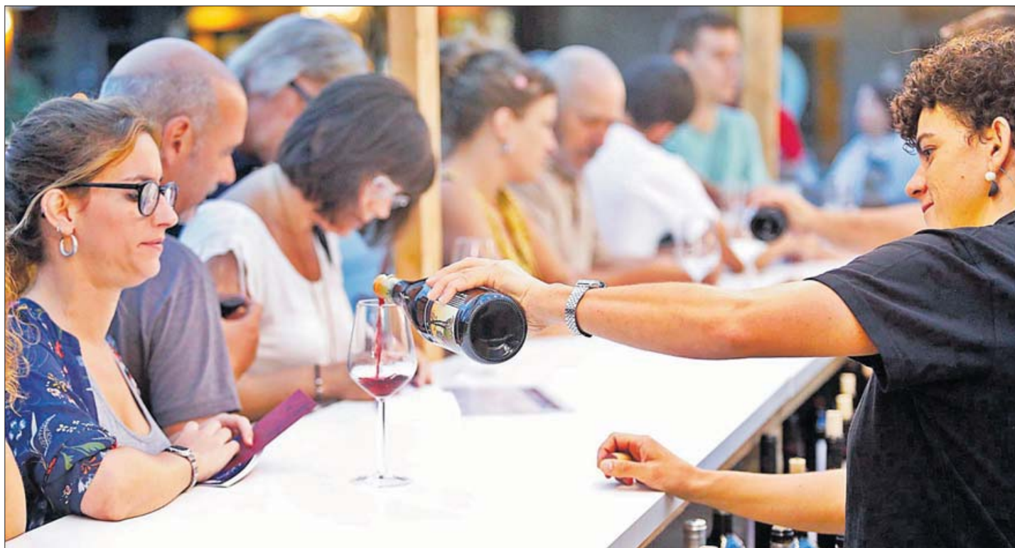
Una imatge de la mostra de l'any passat, en la qual també van participar els principals cellers i elaboradors de vins i cava de diferents punts de la geografia catalana. ANIOL RESCLOSA.