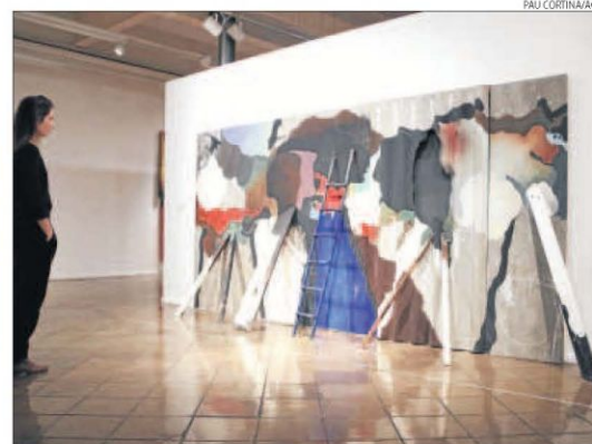
Una jove observa 'Brotxa i banera' als Espais Volart.