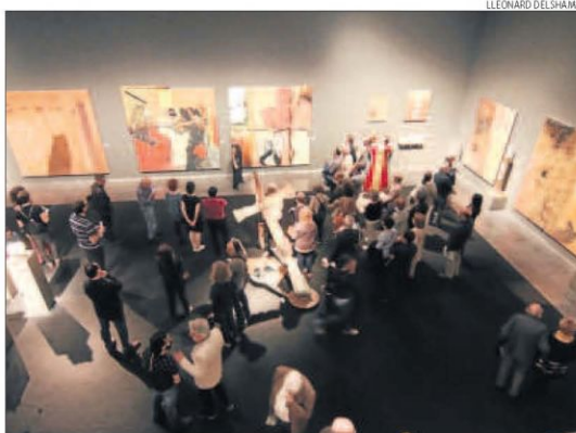
El Museu de Lleida va acollir l'exposició 'Agramuntophitecus'.