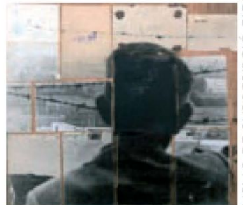
Dues peces de la nova sèrie