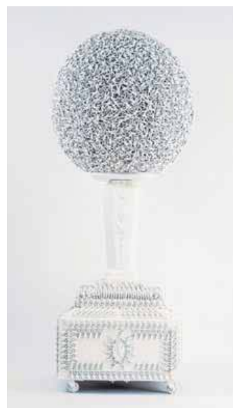
Imatges relacionades amb les exposicions de Stanley Kubrick, Lee Miller, Toulouse-Lautrec, Plensa, els primers viatges de Picasso a París (l'obra és de Cézanne) i el pop art català (l'obra és de Miralda)

sos) i Ribera, Zurbarán i Murillo (en la dels espanyols). Un conjunt de primera amb el qual es vol fer destacar l'originalitat de Velázquez.