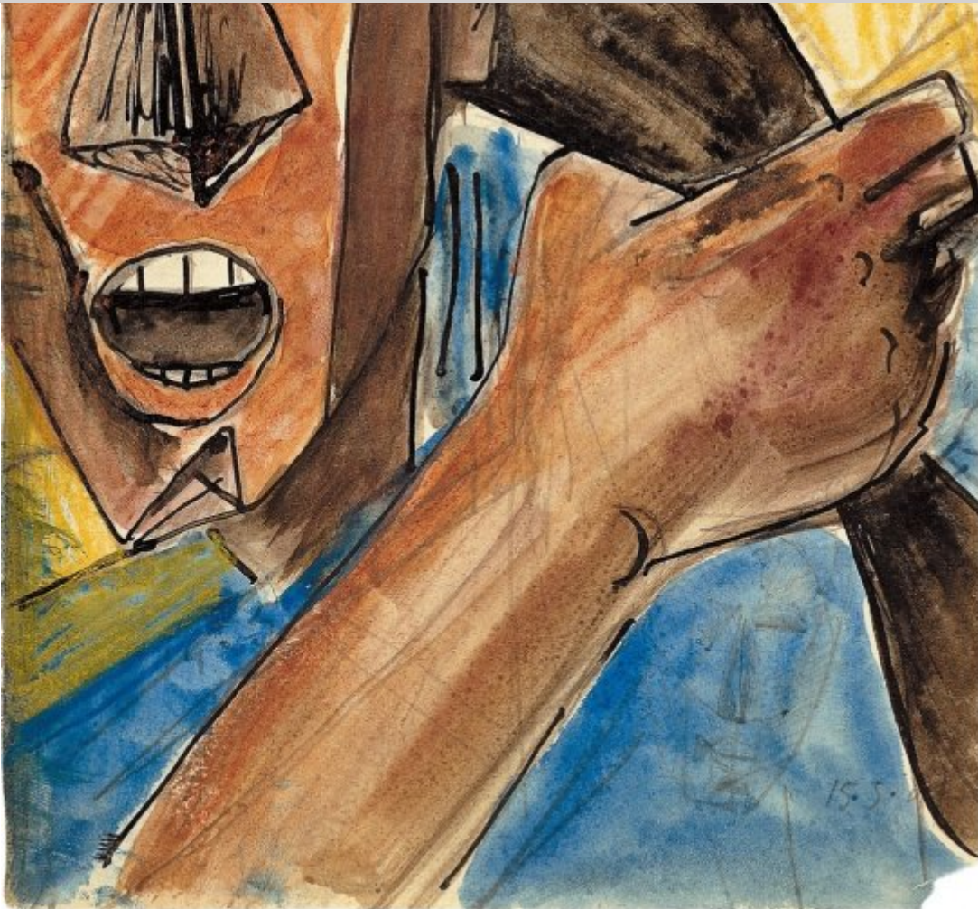
Julio González, Visage criant a la grande main , 1941. IVAM.