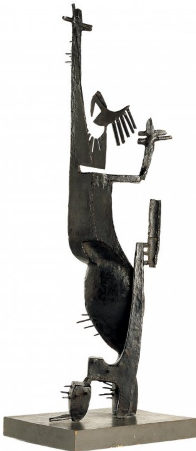
Julio González, Madame cactus . 1939-1940. Bronze forjat. 79,3 x 25,6 x 192 cm. IVAM.