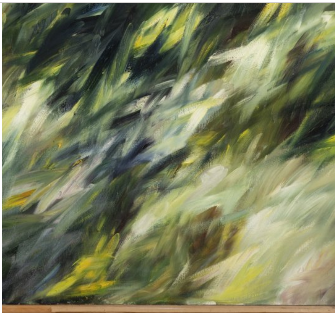
Manuel Duque. Sense títol, 1981. Oli sobre tela. 162 x 130 cm.