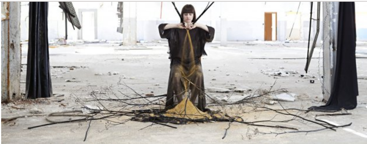
Soledad Córdoba. Devastación V , 2016. Tintes pigmentades en paper baritat sobre dibons. 100 x 150 cm. Col·lecció DKV.