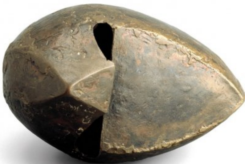
Julio González, Le Cagoulard (L'encaputxat) , 1935. Bronze forjat. 15 x 22,8 x 20 cm. IVAM.