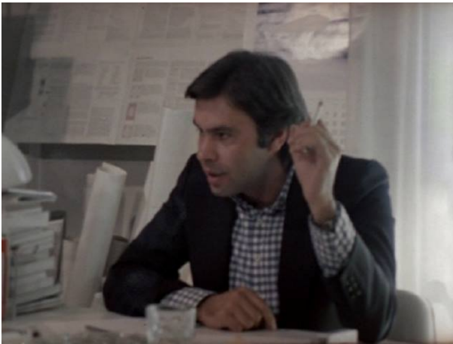
Felipe Gonzáles el 1976, imatges del film 'Informe General (I)', de Pere Portabella

Portabella va filmar aquella realitat des d'una subjectivitat gens camuflada, fent servir tècniques pròpies de la ficció que difuminen la categoria de documental. Més de dues hores de converses en les quals Jordi Pujol , Enrique Tierno Galván o Santiago Carrillo , entre molts altres, deixen de ser polítics i “es converteixen en actors que s'interpreten a ells mateixos”, segons va afirmar el director en el col·loqui posterior a la projecció. Parlen de política, esclar, però el film desnaturalitza els diàlegs movent la càmera i mostrant la tramoia per recordar-nos que la frontera entre cinema i realitat és porosa. Una mirada de Joan Raventós mentre Pujol parla fora de camp ens suggereix que una entrevista sempre és més que una entrevista, travessada d'infinites interpretacions possibles que se'ns escapen. La lluita obrera a Catalunya és prèvia o simultània al reconeixement nacional? Mentre els polítics ho discuteixen, Portabella desplaça el quadre buscant ressonàncies poètiques que deixin clar que no tot es pot reduir a l'esgrima intel·lectual. La provocació de recórrer a la sonoritat burocràtica d'“Informe General” per titular un film curull de recursos artístics conté aquest mateix manifest portabellià ( https://www.nuvol.com/noticies/pere-portabella-lartista-es-un-paleta-no-un-nen-especial/ ): el cinema no amaga la veritat, sinó que ens hi acosta.