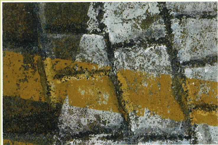
Fragment Asfalt BCN III, 1999