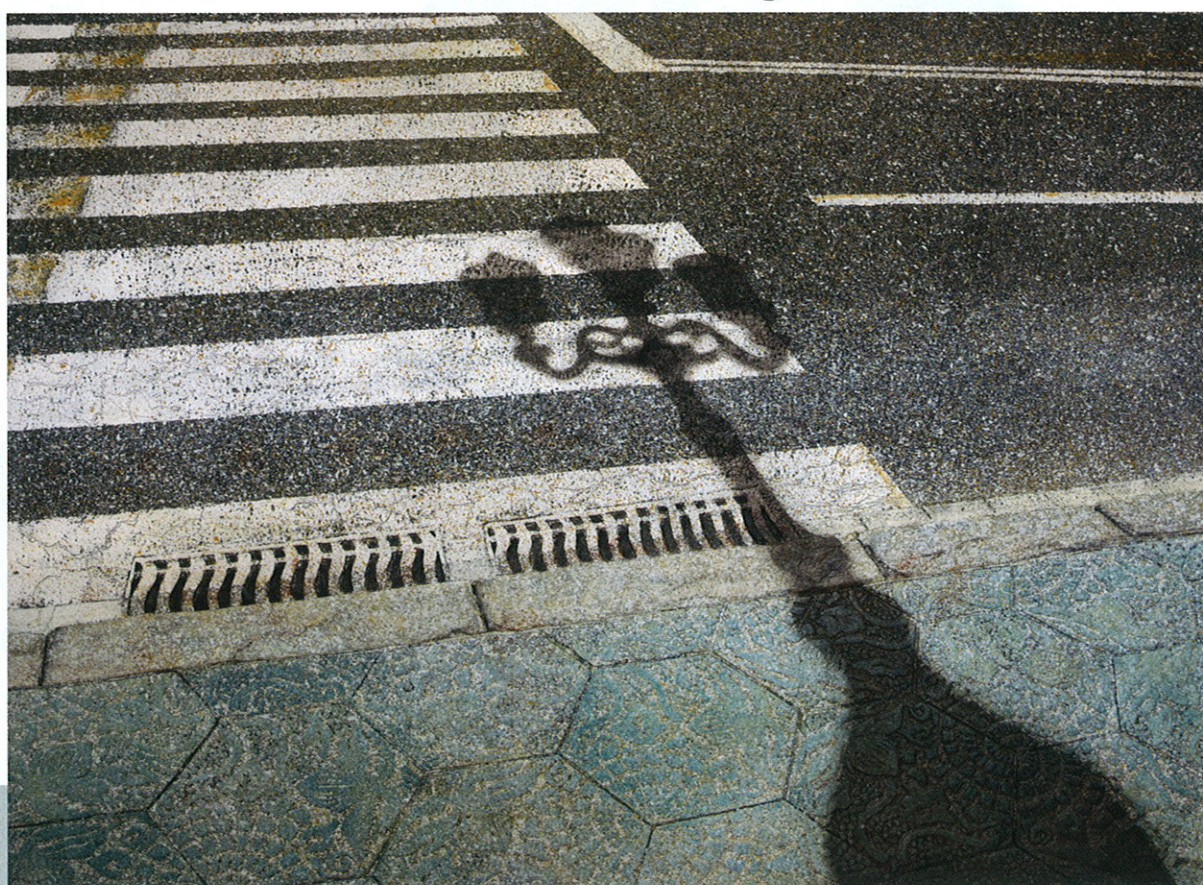
Passeig de Gràcia, 1999