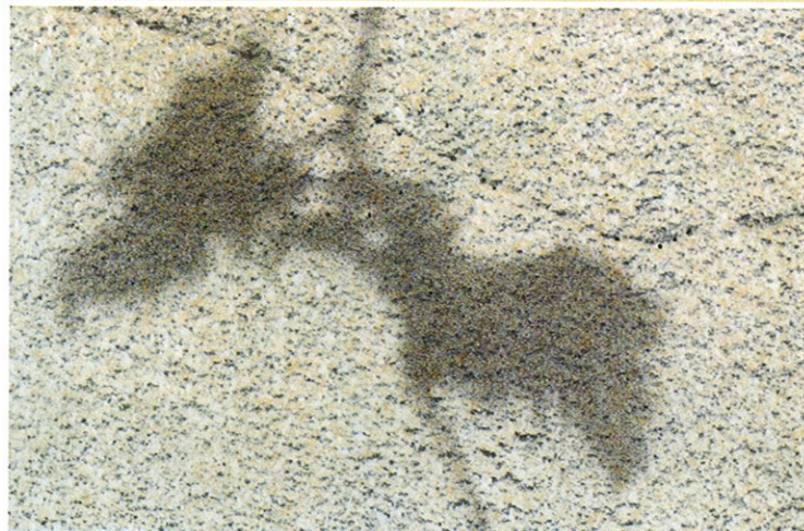
Fragment Shadow , 2006