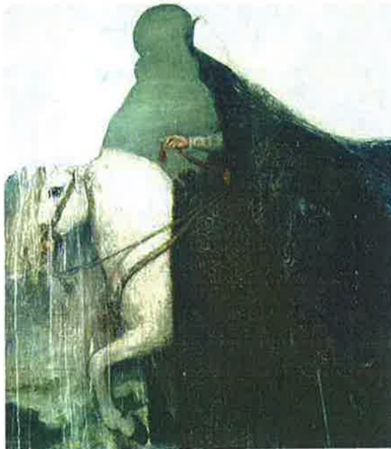
Alamà. El telón de Francia, 2017, Homenaje a Velázquez: La reina Isabel de Francia a caballo . Tècnica mixta sobre fusta. 114x100 cm.