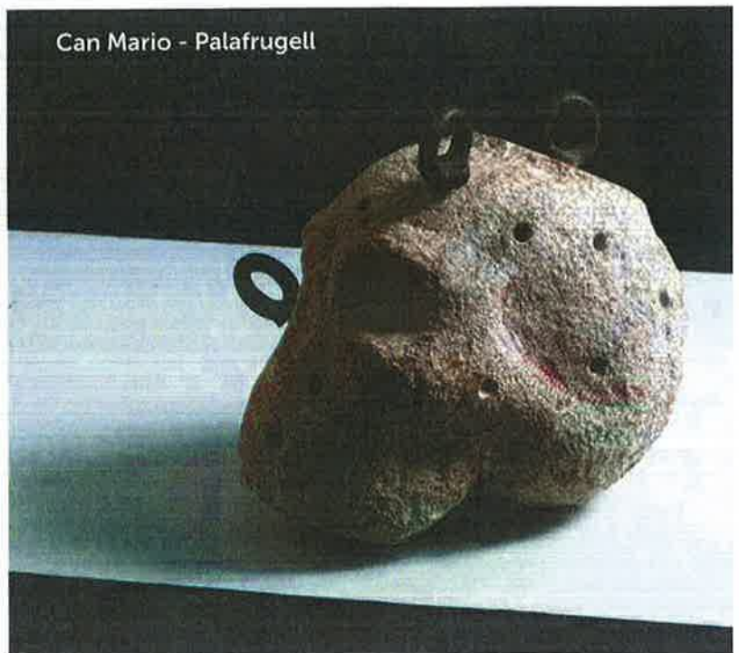
Can Mario - Palafrugell