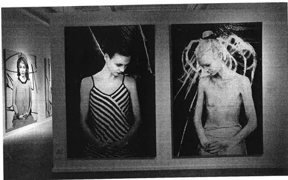
Lita Cabellut ha inaugurat l'ampliació dels espais expositius de la Fundació Vila Casas.

milions del 2014 que el van col·locar en la primera posició el 2012/13/14, superant artistes tan demandats com ara Picasso, Gerhard Richter o Francis Bacon. Salvant les distàncies i sense voler fer comparacions, es presenta a la Fundació Vila Casas una àmplia retrospectiva de l'artista espanyola Lita Cabellut (Sariñena, Osca, 1961) la gran desconeguda del públic espanyol. Amb una trajectòria llarga i prolífica, la seva obra ha trobat en el mercat internacional una acollida inaudita i complexa d'explicar. Tot va començar el 2015 en aparèixer en el lloc 333 del rànquing dels 500 d'artistes contemporanis, en el qual va aconseguir unes vendes de més de mig milió de dòlars i un rècord en una obra seva que va assolir els 140.000 dòlars. Al davant només hi ha dos artistes espanyols, Juan Muñoz i Miquel Barceló. El 2016 la trobem en el lloc 2.997 del rànquing general i encara que amb