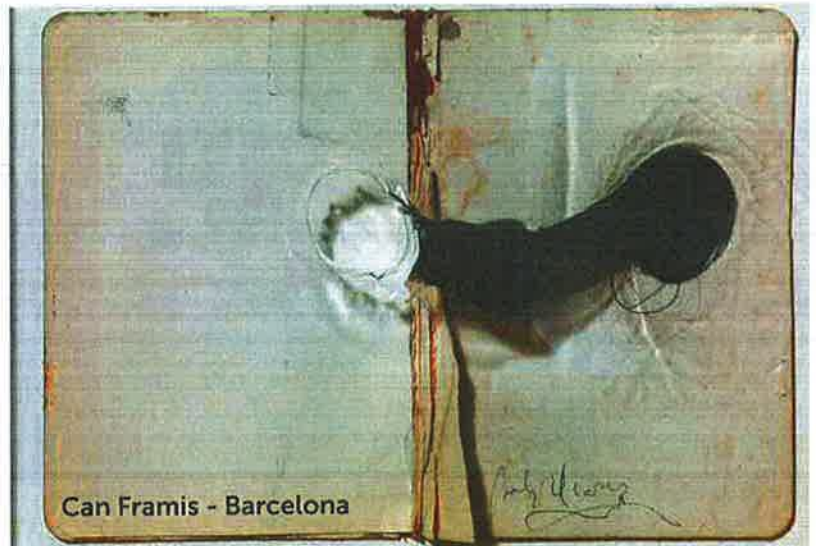
Can Framis - Barcelona

L'efecte Lita Cabellut. Ja fa estona que Vila Casas no amaga l'interès que li desperta l'obra de Lita Cabellut (Sariñena, 1961). "Vaig veure per primer cop uns quadres seus a casa d'un amic i em van cridar molt l'atenció", comenta. El 2013, l'Espai Volart 2 li va dedicar la mostra Trilogia del dubte i ara, quatre anys després, es presenta una gran retrospectiva –amb una seixantena de peces realitzades al llarg de l'última dècada– que ocupa la pràctica totalitat de l'Espai Volart. La mostra Lita Cabellut. Retrospective , que es va inaugurar el 5 d'octubre passat i que es podrà visitar fins al 27 de maig del 2018, ha estat concebuda a quatre mans, entre la creadora pluridisciplinària, resident a Holanda, el país on ha desenvolupat la seva carrera artística, i el mecenes. "M'agraden els temes que tracta en la seva pintura i com els executa –diu el col·leccionista–; té una trajectòria molt variada que m'interessa especialment."