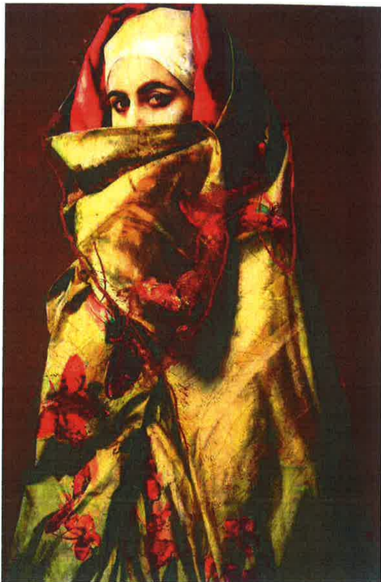
Lita Cabellut. Private Secret Behind The Veil . Col·lecció particular. Espai Volart de la Fundació Vila Casas.

Però on els valors de l'existència humana prenen més força és en els retrats dobles de la sèrie Disturbance (2015), especialment a les versions 13 i 14, en què ens sembla endevinar un retrat doble de la figura de Meret Oppenheim vestida i nua, amb tota la seva potència humana, tant en la seva imatge seductora exterior com en el recolliment de la seva nuesa interior.