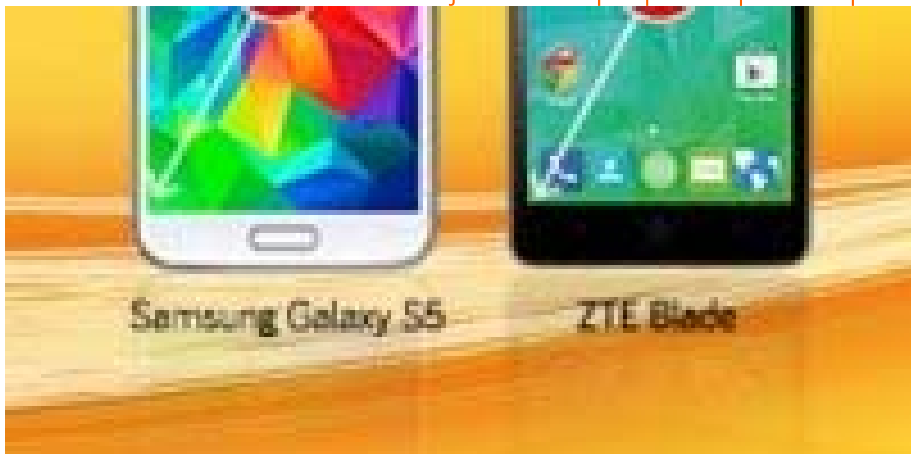
Últim dia: 12 de juliol

Últims dies per aconseguir fibra a 24,14 € i 2 línies de mòbil gratis