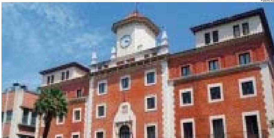
La Guàrdia Civil escorcolla diversos ajuntaments per presumpta corrupció