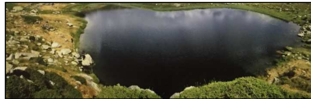
Photographies de Jordi Pantebre, poésies d'Andreu Escalles

Jordi Pantebre s'est initié à la photographie à l'âge de 11 ans avec son père Francesc Pantebre, et a suivi des études à l'Institut Français de la Photographie et de la Cinématographie de Paris et à l'Académie de Toulouse jusqu'en 1969.