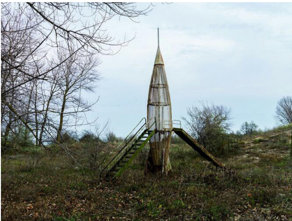
( http://www.nuvol.com/wp-content/uploads/2017/06/rocket2017-dalvaro-sanchez-montanes.jpg )

A més, el Palau Solterra ha acollit una mostra protagonitzada pels finalistes al Premi de Fotografia , que enguany ha comptat amb una selecció de 37 propostes, eclèctiques, suggestives i enigmàtiques que de ben segur no deixaran indiferent a ningú.