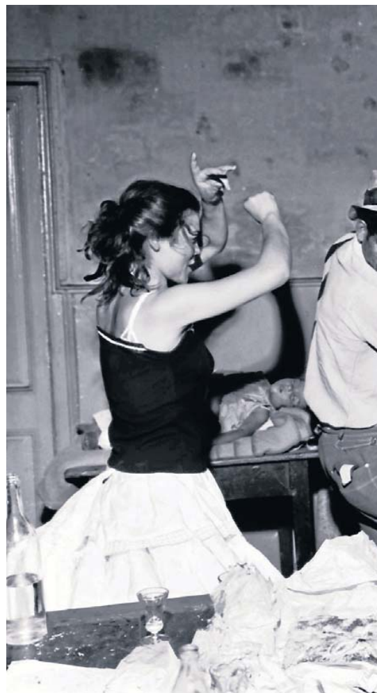
REVETLLA DE SANT JOAN a la bodega Ca La Rosita. Avinguda del Paral·lel, cap al 1960

L'any 2011, l'Arxiu Fotogràfic de Barcelona va organitzar la primera gran exposició de fotografies de temàtica gitana de Léonard. Al llarg d'aquests anys, la mostra ha viatjat també a Portugal i a Girona i el seu interès es revifa a cada lloc on es presenta. ●