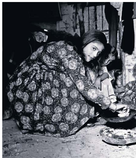
LA CHOCHI I LA MULATA. Montjuïc, 1974