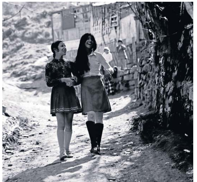
PASSATGE DE LA VINYETA. Montjuïc, 1970