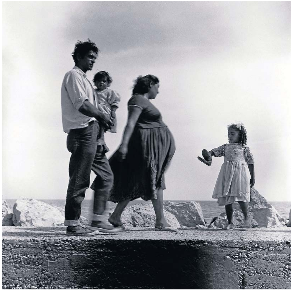
PELEGRINATGE A LES SANTES MARIES DE LA MAR. La Camarga, 1962- 1970