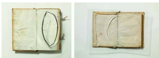
'Petit llibre eròtic', a la izquierda y 'Sense títol', dos obras de Jordi Alcaraz realizadas en 2016.

Las obras de Alcaraz, creadas, muchas de ellas, mediante procesos violentos: los agujeros del cartón se producen tras lanzar piedras y los del metacrilato aplicando fuego, tienen, también, mucho de sensual, por su extraña delicadeza. Como Historia de la pintura : apenas el material plástico deformado en una de sus esquinas enmarcado en negro; Autorretrato , un óvalo recortado que simula un rostro en el metacrilato sobre el fondo de cartón; Partitura , unos alambres que parecen volteados por el aire unidos al elemento transparente o Ideas de pintura , una obra en la que el elemento plástico se ha convertido en pequeñas cavidades en las que la tinta depositada se ha escapado dejando unos pequeños regueros, finos como hojas de espadas.