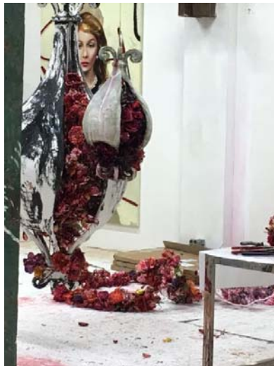
Mix media 'Flores colgando'

Yo creo que las escuelas deberían de extender mucho más la clase de dibujo, pues el dibujo es un medio a través del cual se ejercita la inteligencia.