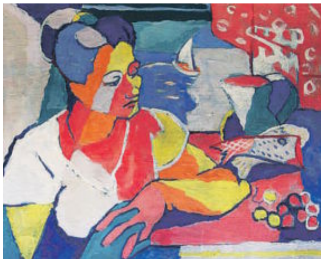
Arriba, Rogent: 'Bodegó de l'Abeda', 1949