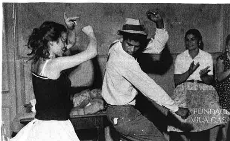
El Palau Solterra de Torroella ens ofereix una mostra de diversos artistes. A la imatge, "Barcelona gitana" de Jacques Léonard

Ramon Dachs (Barcelona, 1959) exposa "De l'Antàrtida a la Torre. Fotopoètiques del silenci", on les seves captures visuals són unes instantànies preses a mode de dietari per a preservar les seves vivències. Creador del concepte d'escriptura geomètrica i fractal iniciat el 1978, que se centra en la translació de l'estructura matemàtica del pensament a l'escriptura,