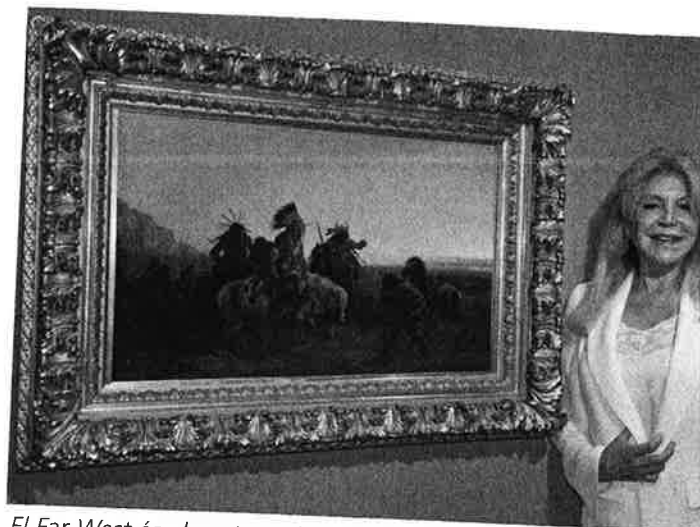
El Far West és el protagonista de l'Espai Thyssen a Sant Feliu de Guíxols

En aquesta ocasió, la mostra ens proposa ser exploradors contemporanis d'una història que coneixem de manera esbiaixada. Per això es rememoren des de les empremtes dels primers conqueridors espanyols del segle XVI a l'imaginari que s'ha popularitzat per la difusió cinematogràfica del gènere del western. Per construir aquest relat es presenten mapes d'època, pintures, escultures, gravats, aquarel·les i objectes antropològics que mostren la idealització d'un territori, un Nou Món que pocs havien trepitjat i que l'art occidental representà per primer cop. Obres que plasmen, entre l'antropologia i la fantasia, la vida de les tribus índies.