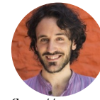
( http://www.nuvol.com/autor/francesc-ginabreda )

Els multiuniversos de l'art i la ciència