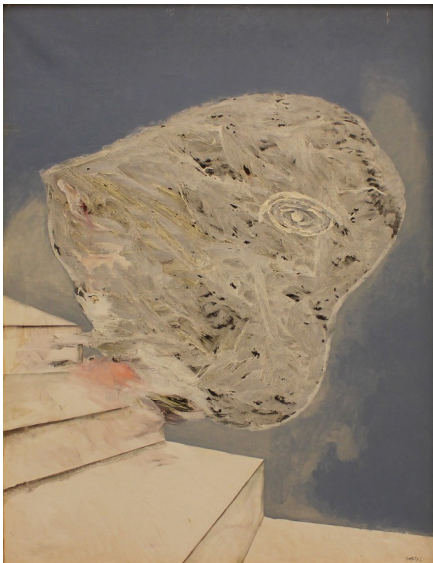
( http://www.nuvol.com/wp-content/uploads/2016/05/1990-Corazón-cayendo-por-las-escaleras-116x89.jpg )

El mateix Bartolozzi, en una conversa gravada amb Bigas Luna, distingia quatre etapes de la seva producció artística. Així ens ho explica Raquel Medina al catàleg: “La de la infància fins a 1955, amb la influència familiar i de llocs tan emblemàtics com el bosc d’Irati. Després, la d’estudis a Barcelona des de 1962 fins a 1966, quan assoleix la professionalitat. La tercera la comparteix amb Arranz Bravo i culmina amb la participació a la Biennal de Venècia de 1980. La quarta ve marcada per la seva instal·lació permanent a Vespella, el seu matrimoni amb Núria Aymamí el 1983 i el naixement del seu fill Nil”.