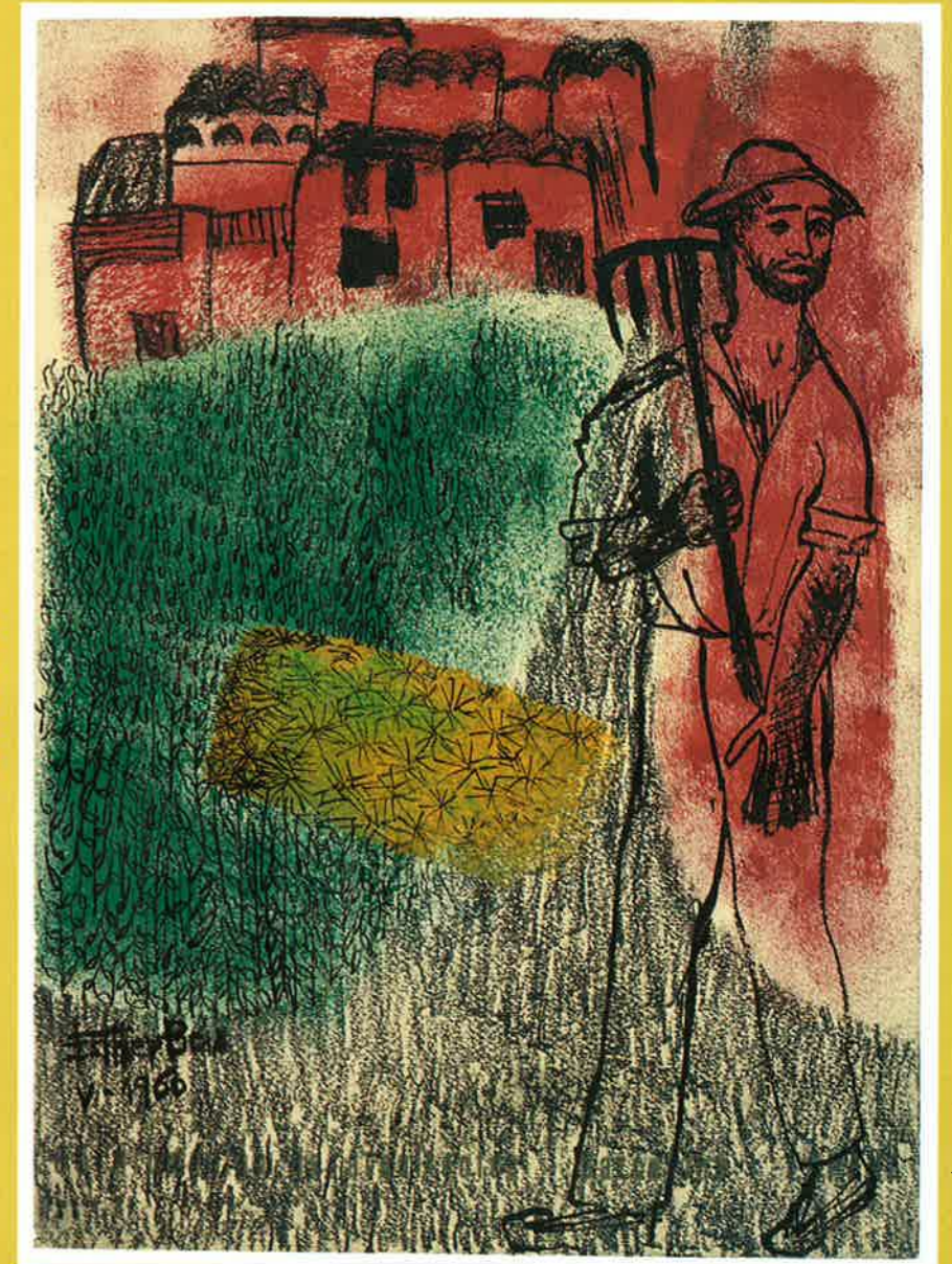
Esther Boix Pagès, 1960

Es podria esbrinar, mirant els colors del cel d'aquest paisatge i pensant quin moment del dia deu ser?