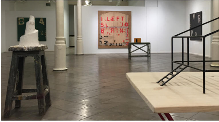
Exposició 'Arquitectures, tipografies i altres volums' a l'Espai Volart.

fragment en surt una cosa monumental, o que una cosa majestuosa pot traslladar-se infinitament a la cosa més humil, però que té la mateixa potència.