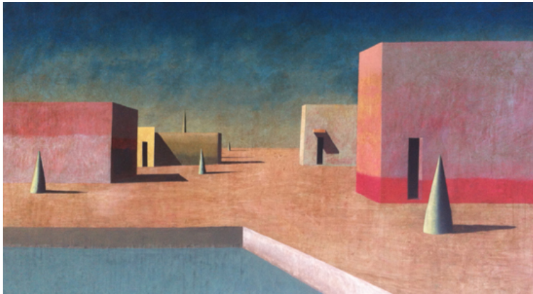
Un dels quadres que formen part de l'exposició 'Arquitectures, tipografies i altres volums'.

Vaig començar pintant la verticalitat dels xiprers i l'horitzontalitat de les parets dels cementiris, elements que plàsticament dins el paisatge són un símbol. Però que tenen una arquitectura simbòlica, no són elements banals. I cada vegada m'interessa més aquest escenari artificial, on hi col·loco la llum, les ombres, les muntanyes... M'agrada obrir una finestra, transmetre una realitat que no és la nostra a través només d'un canvi de colors, volums, llums... Pinto una idea molt particular, i no pretenc agradar a tothom, però sí arribar a l'ànima del que em mira. Són paisatges sense vida, però amb una certa mobilitat que aporta el sol. És un moviment que casi no percebem, que no és directe, però el sol es mou molt.