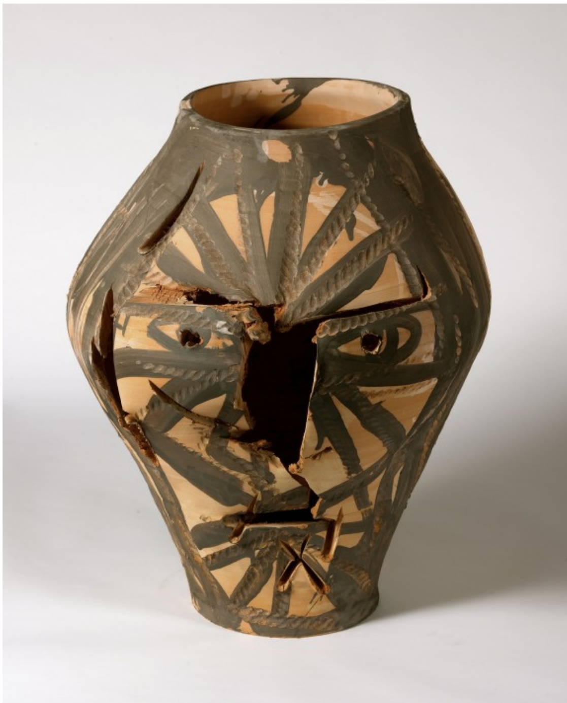
«Ulls clucs. Cera i mica». 80x50x50 cm, cara B. Any: 2010. Autor: Agustí Puig.