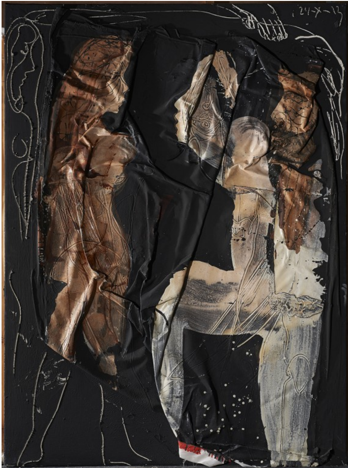
Mixta tela. 210x150cm. Any: 2015. Autor: Agustí Puig.