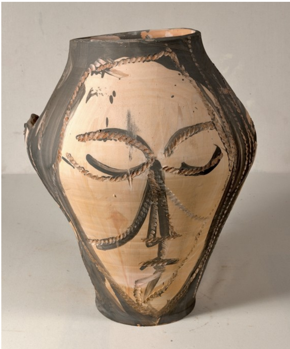
«Ulls clucs. Cera i mica». 80x50x50 cm, cara A. Any: 2010. Autor: Agustí Puig.