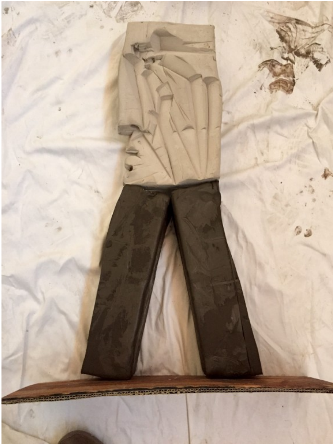
Bronze i alumini. 67x50x18cm. Any: 2010. Autor: Agustí• Puig.