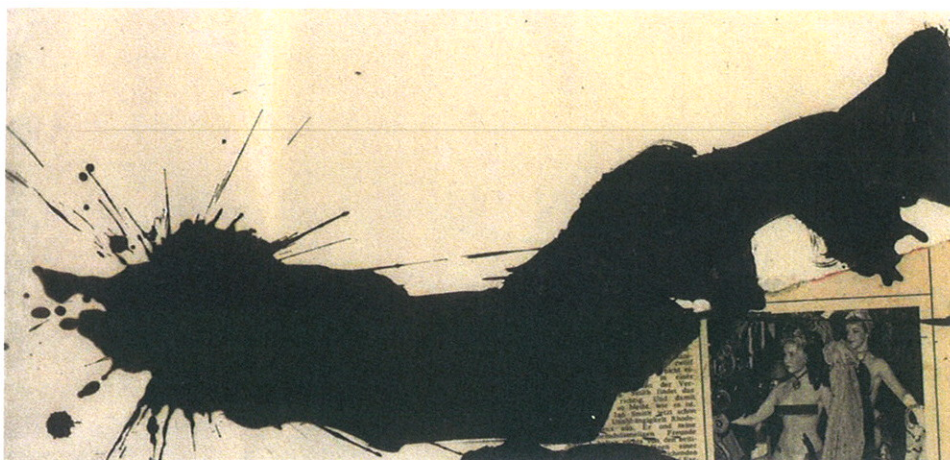
Romà Vallès. Mundo roto , 1965. Fragment.