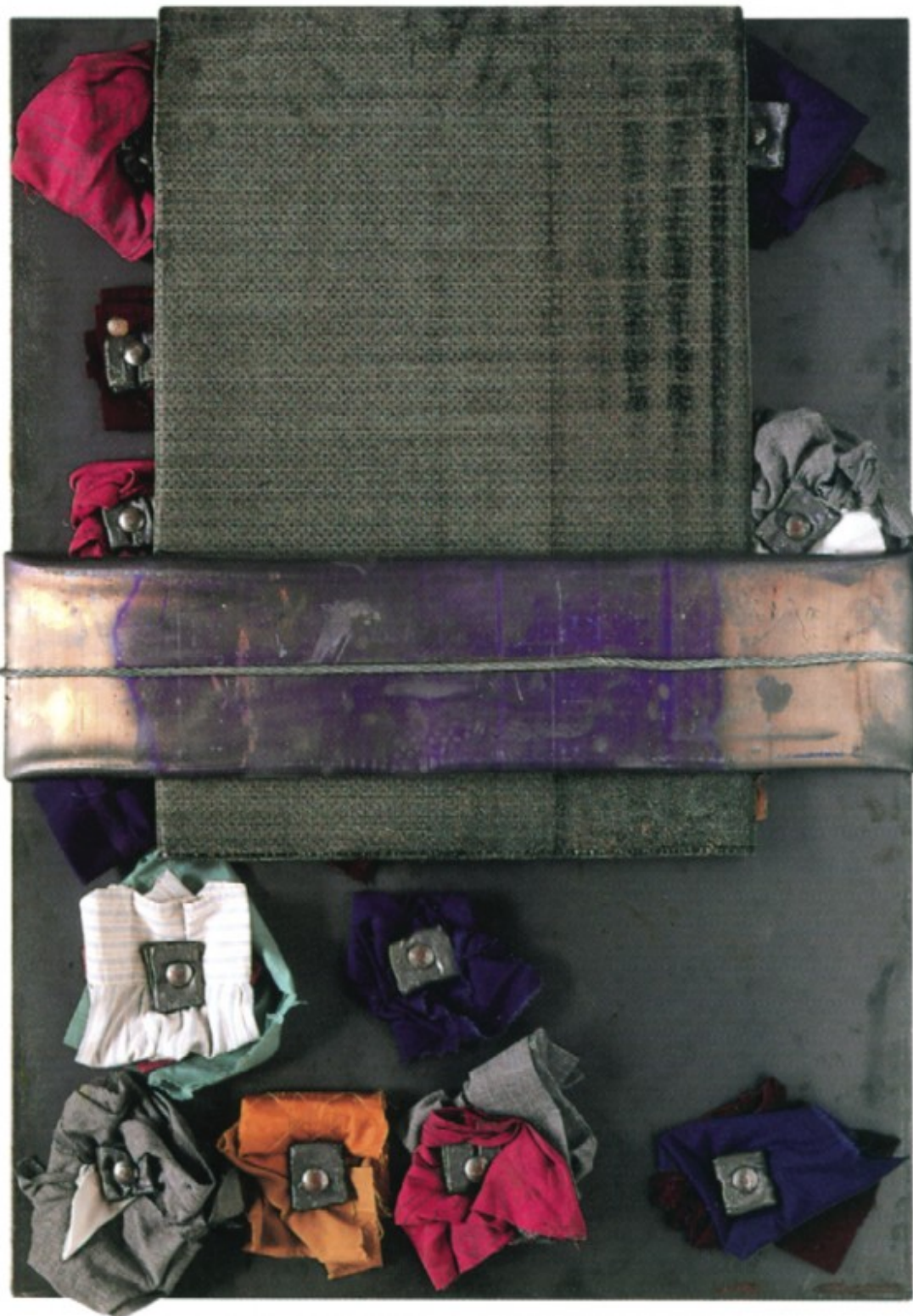
Autor: Jannis Kounellis. Col·lecció: olorVISUAL.