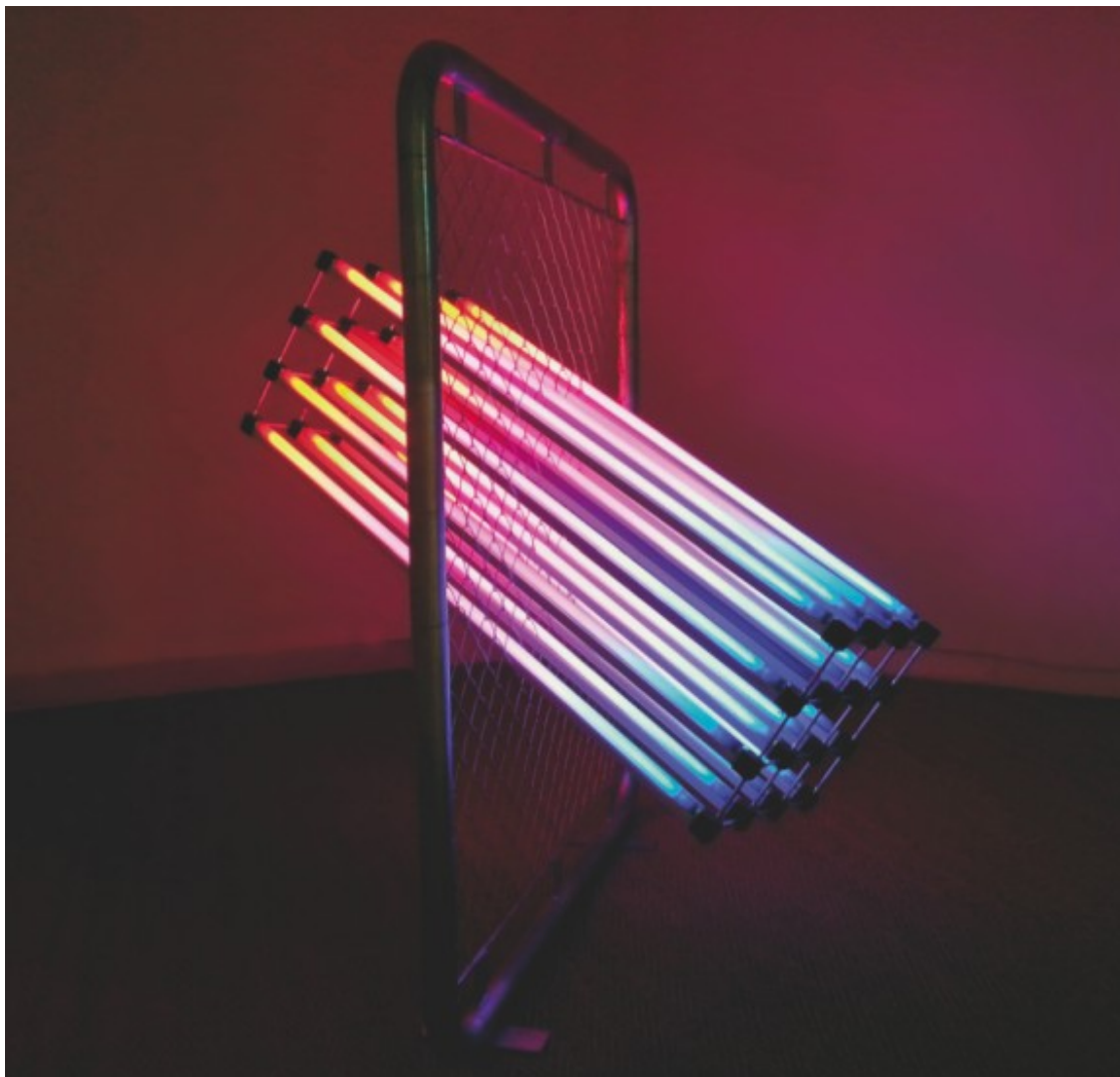
Autor: James Clar. Col·lecció: olorVISUAL.