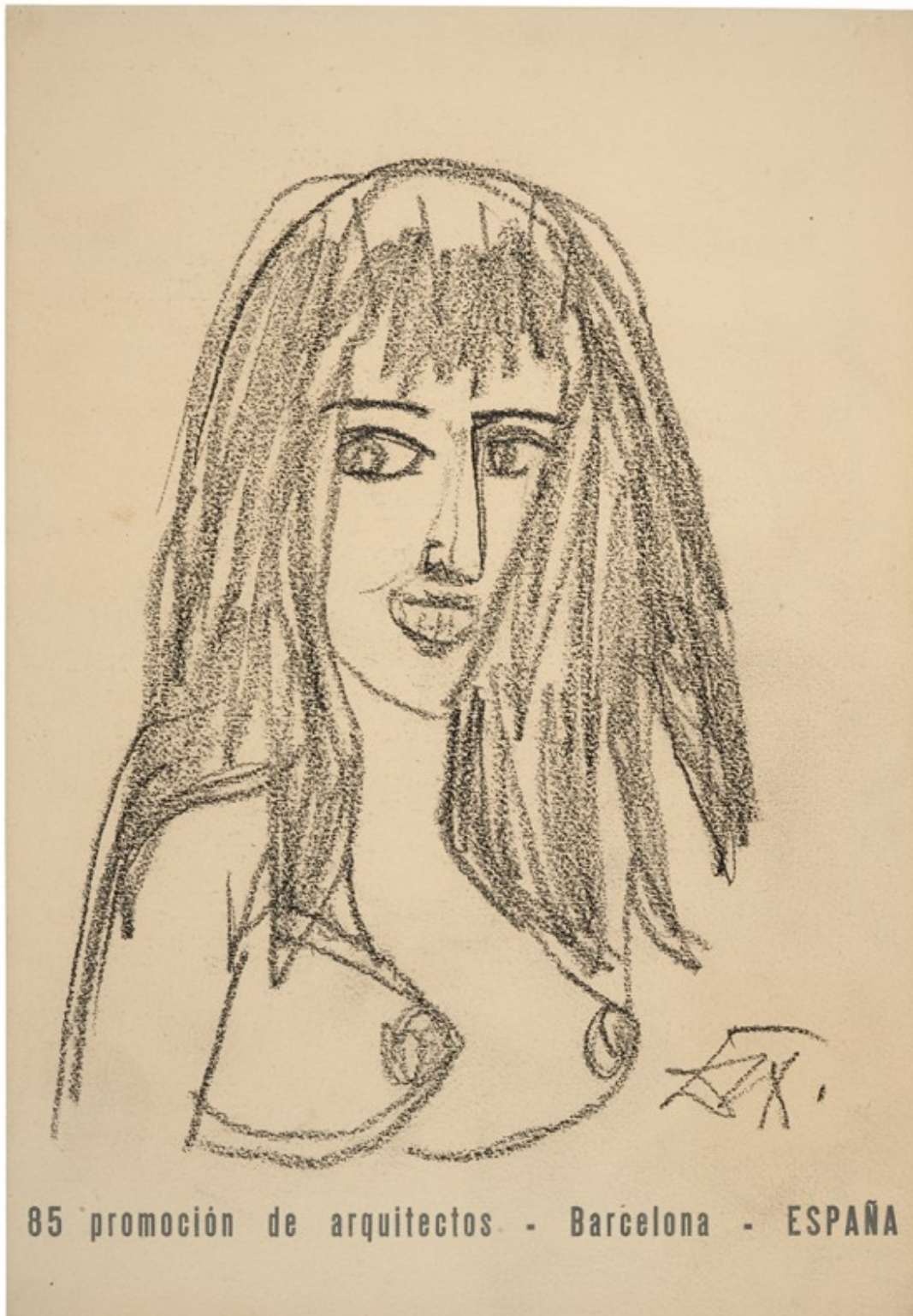
Otto Dix.