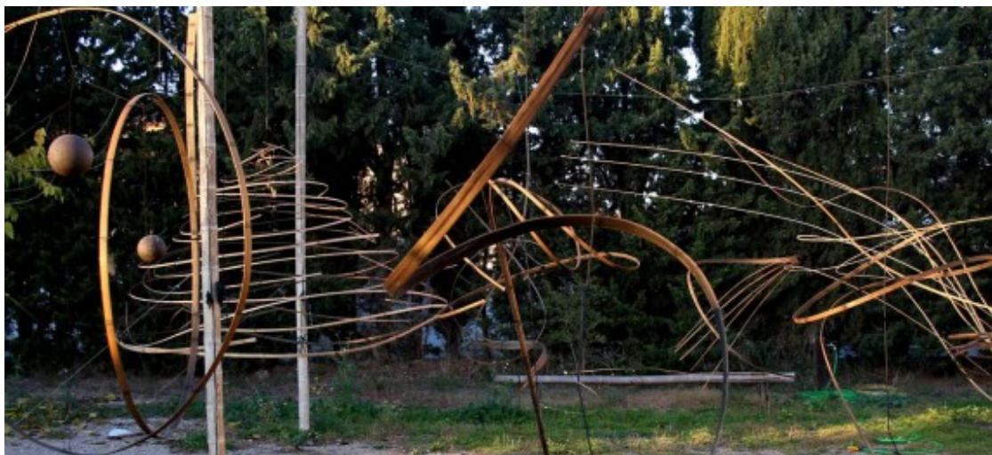
Peces en una fase prèvia a la realització final.