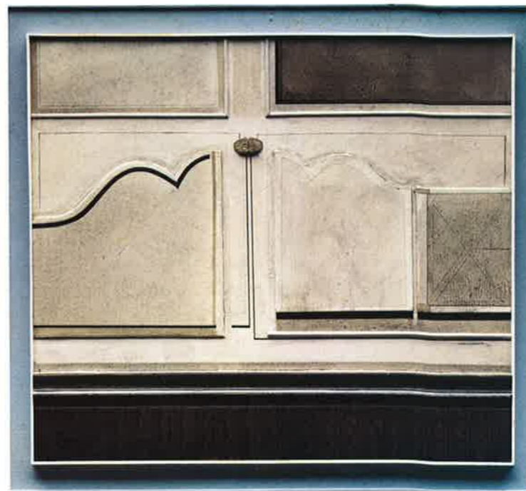
Coma Estadella. Sèrie motlures . 1969, Fundació Vila Casas, Espai Volart 2. Fins al 13 de desembre del 2015.