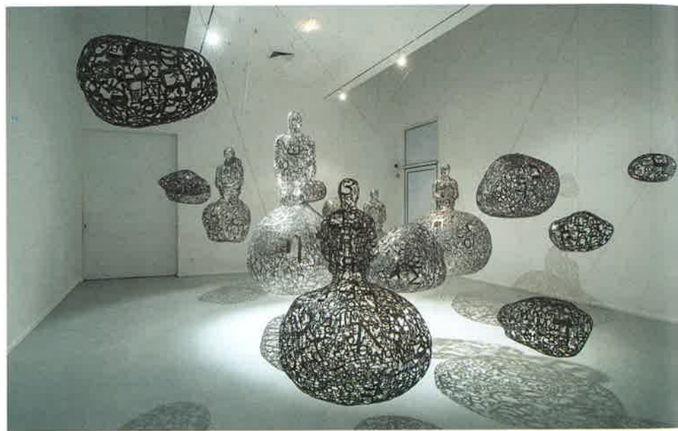
Jaume Plensa. Talking Continents. Museu de Ceret.