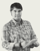
∴ DANIEL VIDAL

Las 'celebrities' se rifan sus cuadros, por los que se pagan hasta 140.000 euros. Lita Cabellut, la pintora española más cotizada del mundo, es una desconocida en nuestro país. «No lo entiendo», confiesa esta gitana, abandonada por su madre prostituta con tres meses: «Yo soy la prueba de que todo puede cambiar»