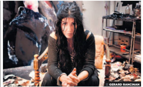
:: GERARD RANCINAN

Lita nunca conoció a su padre. Su madre, una prostituta, la abandonó a los tres meses en Barcelona. Vivió con su abuela, pero su muerte la empujó a la calle, a pedir limosna