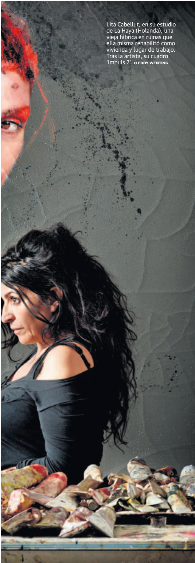
Lita Cabellut, en su estudio de La Haya (Holanda), una vieja fábrica en ruinas que ella misma rehabilitó como vivienda y lugar de trabajo. Tras la artista, su cuadro 'Impuls 7'.

A mi me hubiera gustado llamarme Ana o Sara, ¡o Bárbara!». O simplemente Manuela, se confiesa la pintora española más cotizada del mundo. Lita, de Manuelita, es el diminutivo que su madre adoptiva le encasquetó a aquella gitaniña disléxica de ojos oscuros y vivarachos, que son «la morada» de su duende. Graduada en buscarse la vida por los bajos fondos de Barcelona, hoy todavía elucubra sobre la posibilidad de cambiarse un nombre que siente ajeno. Son sus tres hijos los que tratan de quitarle la idea de la cabeza con un argumento que repiten de forma machacona: Lita le va que ni pintado a la famosa Lita Cabellut (Sariñena, Huesca, 1961), una mujer alegre, arrebatadora, que mastica cada palabra y paladea cada instante, que se abre en canal en la conversación y que se define sin tapujos: «Obsesiva, nerviosa, cariñosa, comprensiva». Un «claroscuro», porque «la sombra no existe sin la luz».